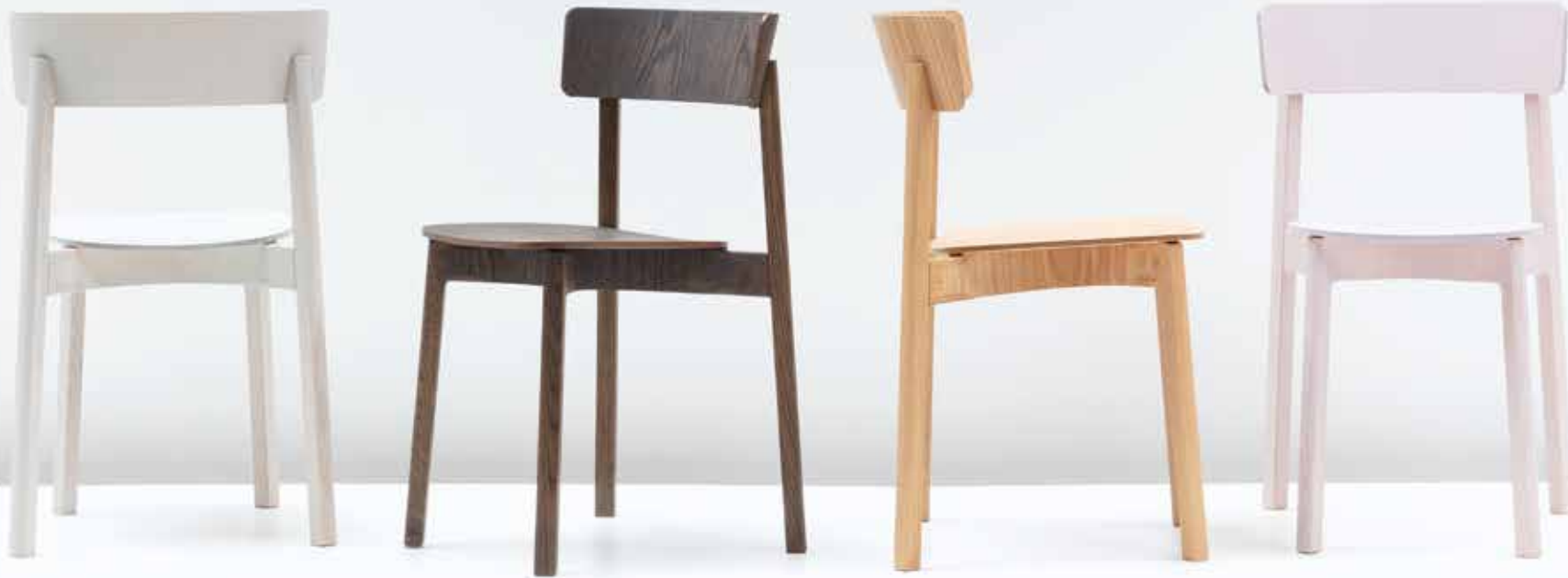
Stühle und Tische vom UMLBERG

Der Entwurf definiert die traditionelle Zargenkonstruktion neu und prägt dadurch den Charakter des Stuhles. Durch diesen Designansatz beginnt die Gestaltung im Herzen des Stuhls, schafft von innen nach außen eine unverwechselbare Ästhetik. Ein archetypischer Holzstuhl, neu interpretiert.